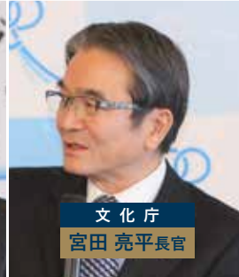
文化庁 宮田 亮平長官