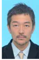
増井 国光氏 スポーツ庁参事官 (地域振興担当) ／パネリスト