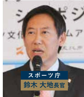
スポーツ庁 鈴木 大地長官